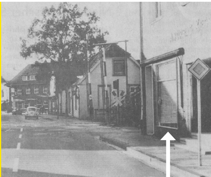
Georgstraße um 1973