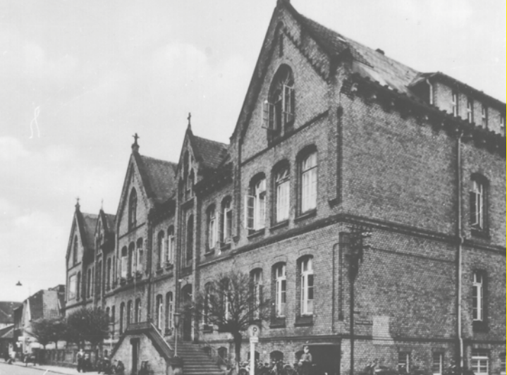
St. Bonifatius-Hospital um 1955

später, 77-jährig, an den dort herrschenden unmenschlichen Lebensbedingungen gestorben ist.