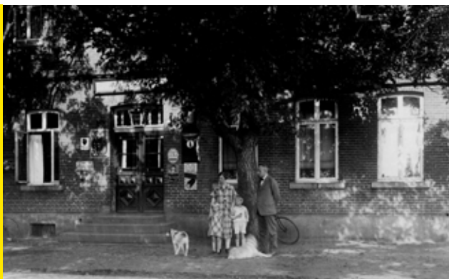
Gastwirtschaft und Kolonialwarenladen Thiele