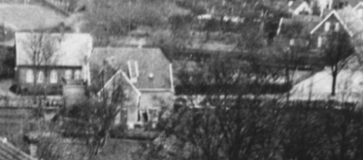
Rückansicht Haus Herz (rechts die Kreuzung Wilhelmstraße/ Waldstraße/ Klasingstraße mit Kastanie) Foto vor 1936