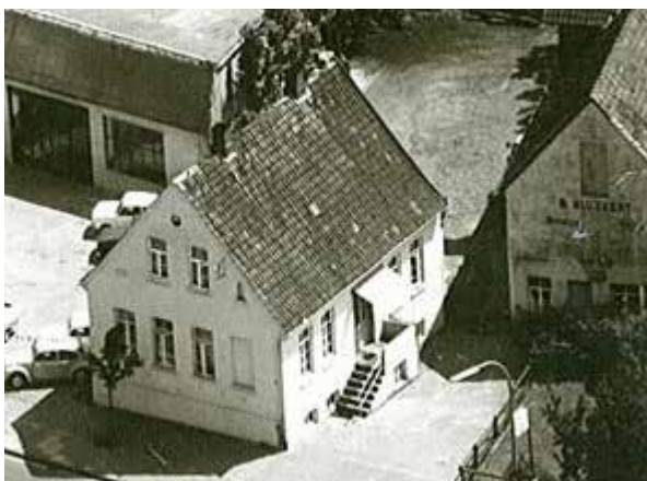
Gelände um die frühere Mühle Vossaar