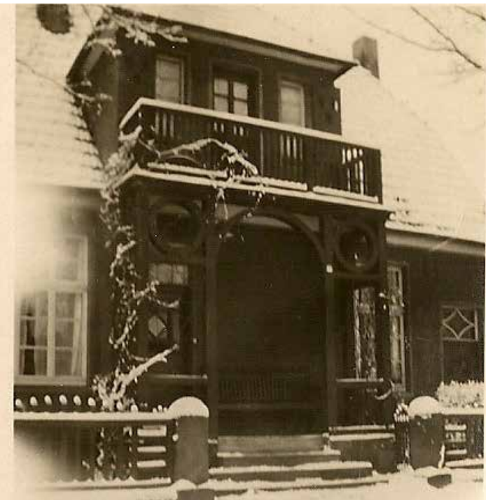
Vorderansicht Haus Herz Wilhelmstraße 21